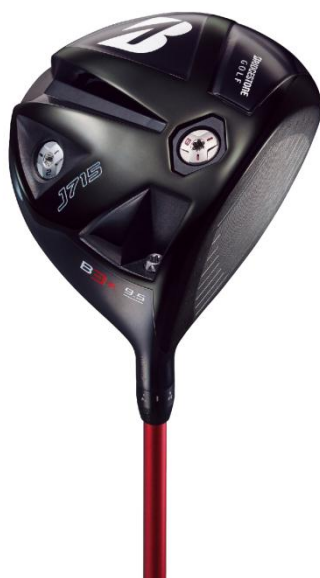
【J715 B3 + 】