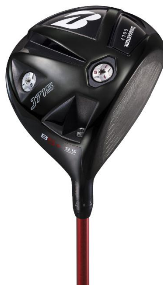
【J715 B5 + 】