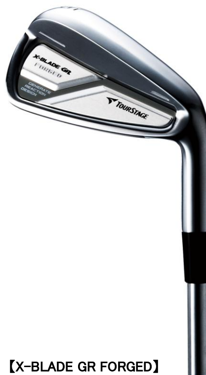
【X-BLADE GR FORGED】