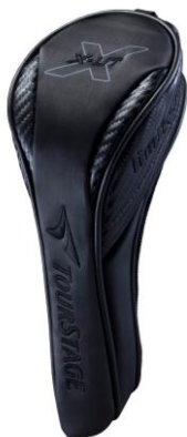
■専用ヘッドカバー付 (中国製)