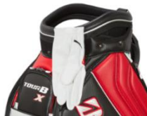
(グローブホルダー)