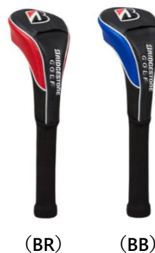
コーディネイトヘッドカバー（HCG41B）