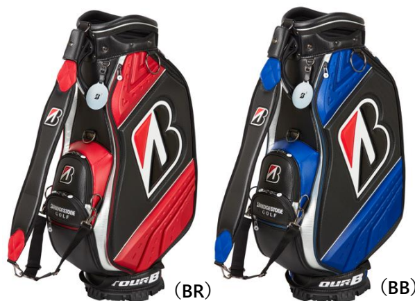
ツアーレプリカ限定企画キャディバッグ（CBG41B）

当社はゴルフにおける様々な“接点”を、タイヤ開発で培われた解析技術などを活用し「接点を科学」することで、独自の商品開発やサービス提供に繋げ、もっとうまくなりたい、もっとゴルフを楽しみたい、そう考えるすべてのゴルファーが「最高のパフォーマンス」を発揮できるよう取り組み続けてまいります。