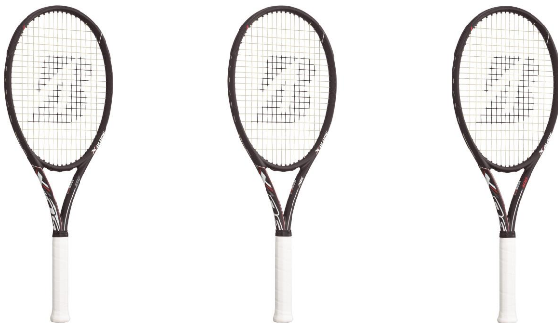
X-BLADE Rs 300 X-BLADE Rs 285 X-BLADE Rs 270

本件に関するお問い合わせ先 <報道関係> ブランド・広報・マーケティング戦略部 TEL: 03-5425-8650 <お客様> お客様コールセンター TEL: 0120-116613