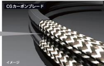
CGカーボンブレード