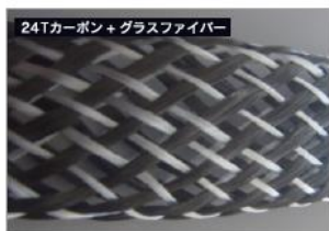
24Tカーボン+グラスファイバー

カーボン繊維を筒状に編みこんだシームレス構造。 高密度で画一的な剛性となり、余分なねじれを抑制。 ボールを包むようなホールド感とマイルドな打球感を追求。