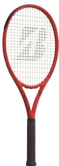
X-BLADE Rs 300

http://www.bs-sports.co.jp/press/2018/t0117_x_blade_rs/t0117_x_blade_rs.pdf