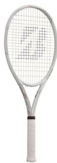
X-BLADE Rs 270