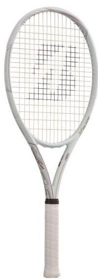
X-BLADE Rs 285