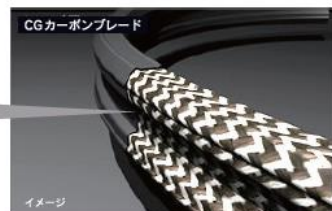
CGカーボンブレード