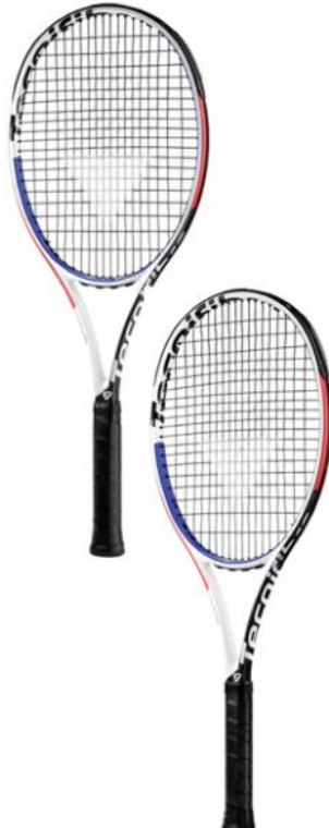
(T-FIGHT 300 XTC)