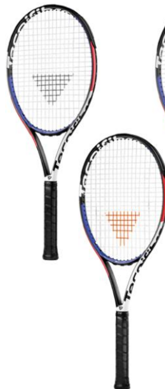
(T-FIGHT 265 XTC)