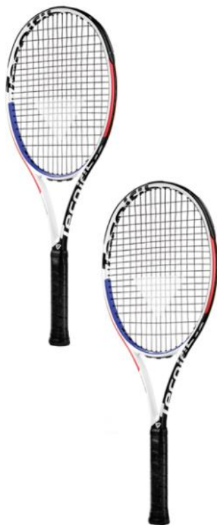
(T-FIGHT 305 XTC)