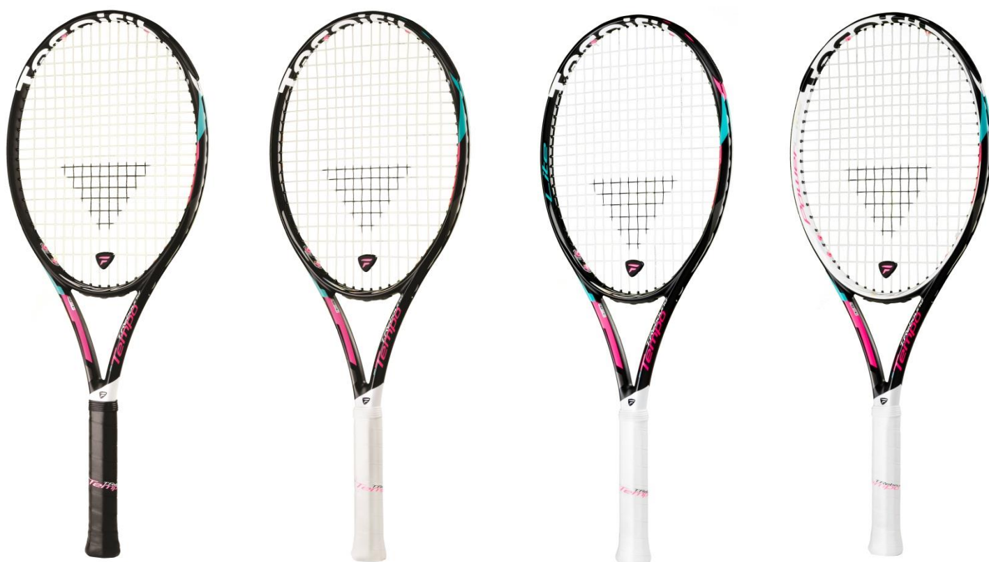
【T-Rebound TEMPO 290】

ブラックをベースに、人気の“ピンク”をキーカラーとし、青色でアクセントを加えた女性専用のデザインです。