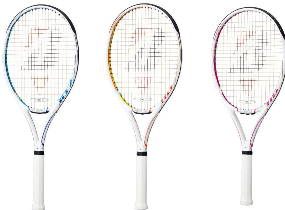
calneo 280 calneo 265 calneo 230

『calneo 230』の新色は「ピンク」で、ダブルスプレーヤー向けに、重量 230g(平均)とシリーズ最軽量モデルです。